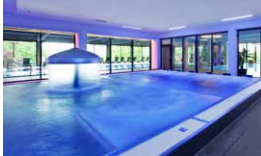
Schwimmbad mit 20 m Sportbecken