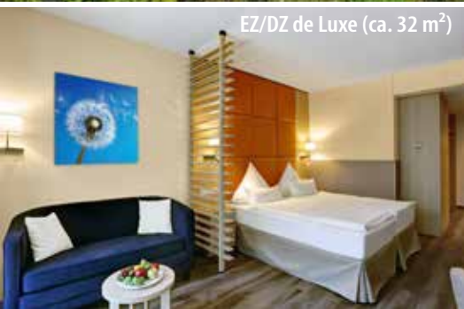
EZ/DZ de Luxe (ca. 32 m 2 )