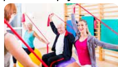
ÜBUNGEN MIT THERA-BAND

Durch den Einsatz verschiedener Hilfsmittel (z. B. Hanteln) werden unterschiedliche Muskeln trainiert und der Spaßfaktor ist gegeben.