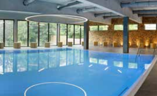
ca. 33°C warme VITAL-Quelle