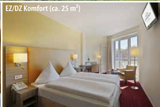
EZ/DZ Komfort (ca. 25 m 2 )